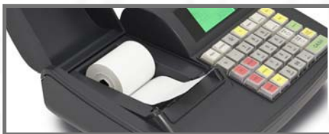
VIENKĀRŠA LENTES MAIŅA