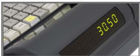
LED KLIENTA DISPLEJS