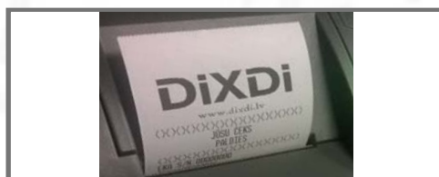
GRAFISKS LOGO UZ ČEKA