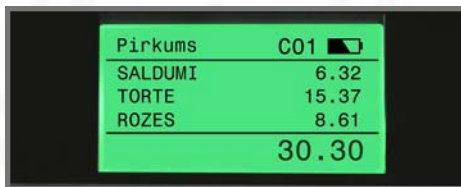
GRAFISKS LCD DISPLEJS